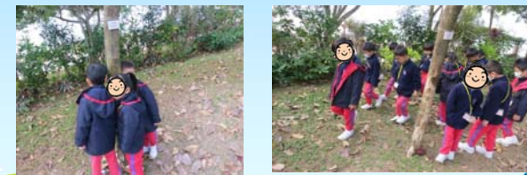
幼兒主動探索外界的聲音