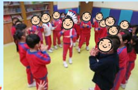
音樂課堂模擬活動