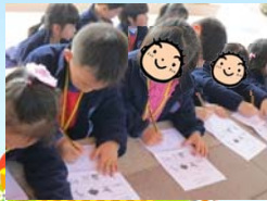
記錄日常生活中的聲音