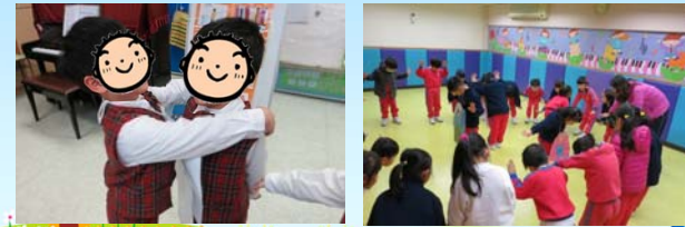
幼兒以舞蹈表達情感