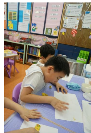
探索以不同工具去製作汁液，以天然顏料去繪畫