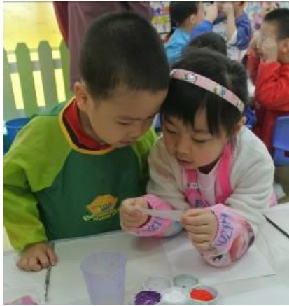
幼兒以二人一組以膠片於課室內進行觀察。