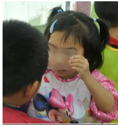
幼兒以膠片放在眼前並觀察對方的容貌。