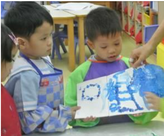
幼兒分享其作品內容。