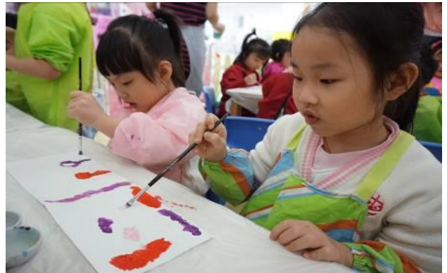
幼兒運用點描的方法合作創作。