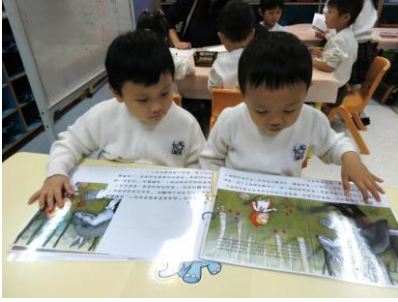
自行分享閱讀圖書