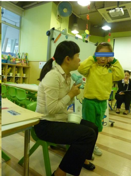
給人們遺棄的感覺是.....