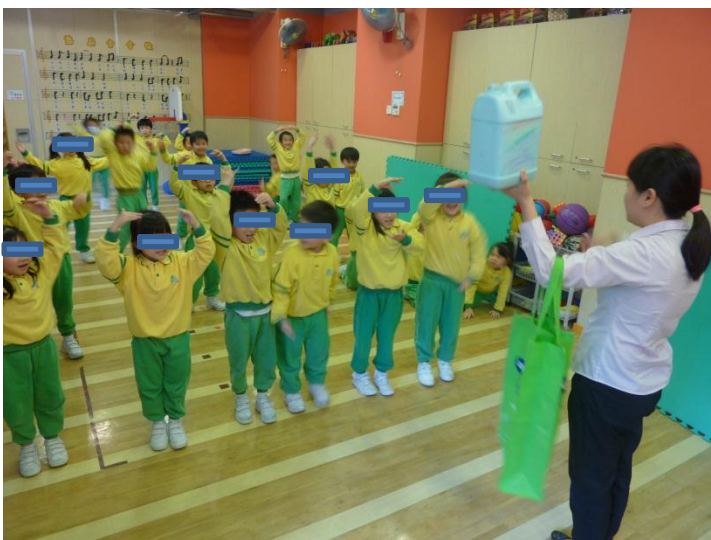
齊來動一動【物品扮演遊戲】。