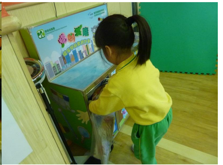
廢物分類回收大行動。