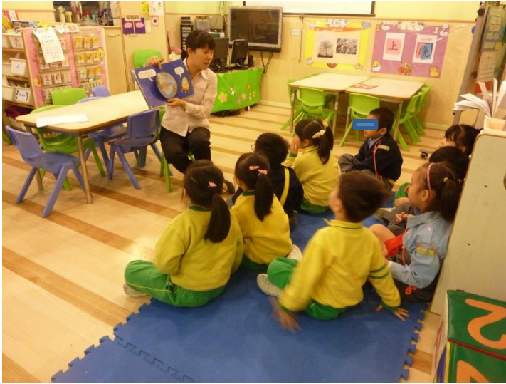
故事引入『小探險家的問號』