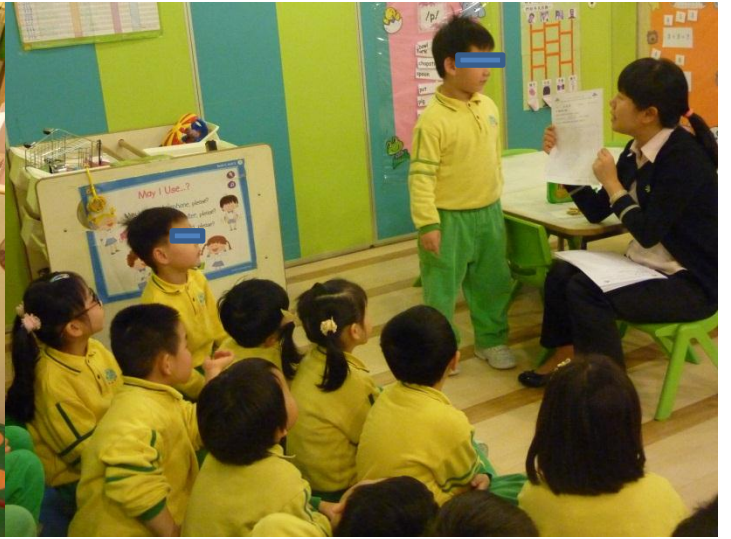
環保資料搜集及分享活動。