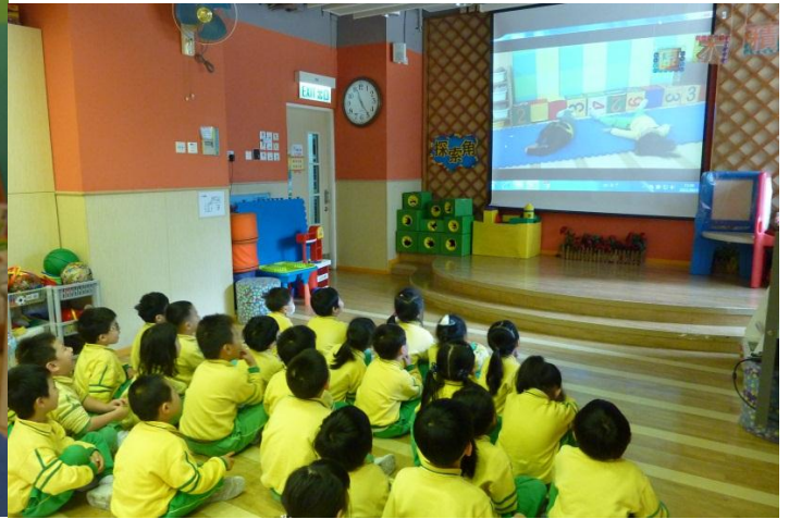
環保戲劇《廢物大變身》