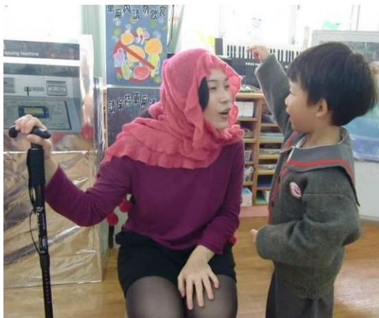
以教師入戲的手法讓幼兒有進一步的感受與體驗及嘗試解難