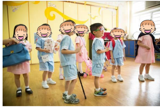
觀察後以肢體動作進行演繹