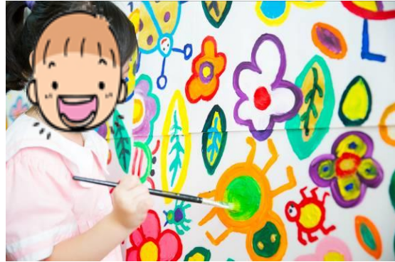
幼兒按協商的內容一同設計心目中的理想港鐵