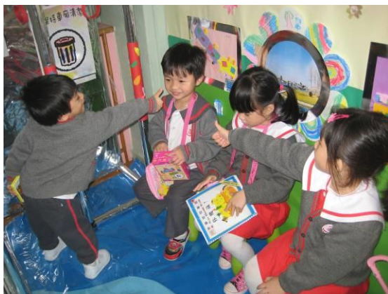
幼兒自編自導自演屬於他們的戲劇